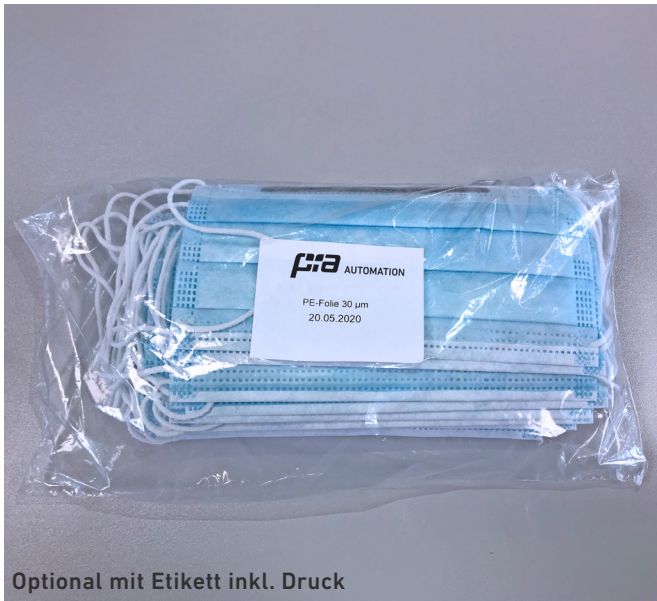
Optional mit Etikett inkl. Druck