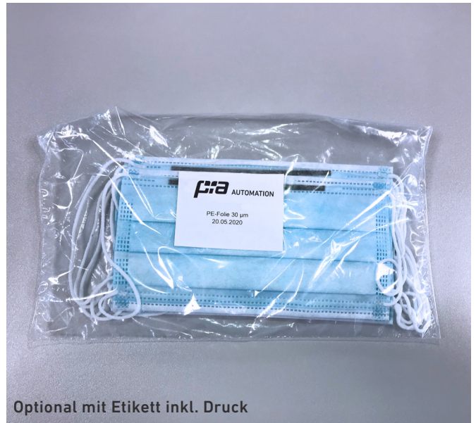
Optional mit Etikett inkl. Druck